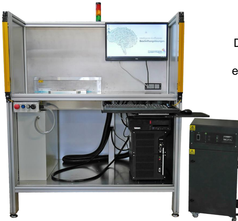
Laserkennzeichnungsanlage mit Dreheinheit

Mit dem Wechsel auf ein anderes Bauteil können die Werkstückaufnahmen unkompliziert gelöst und gewechselt werden. Anschließend stellt sich die Anlage vollautomatisch auf das nächste Produkt ein.